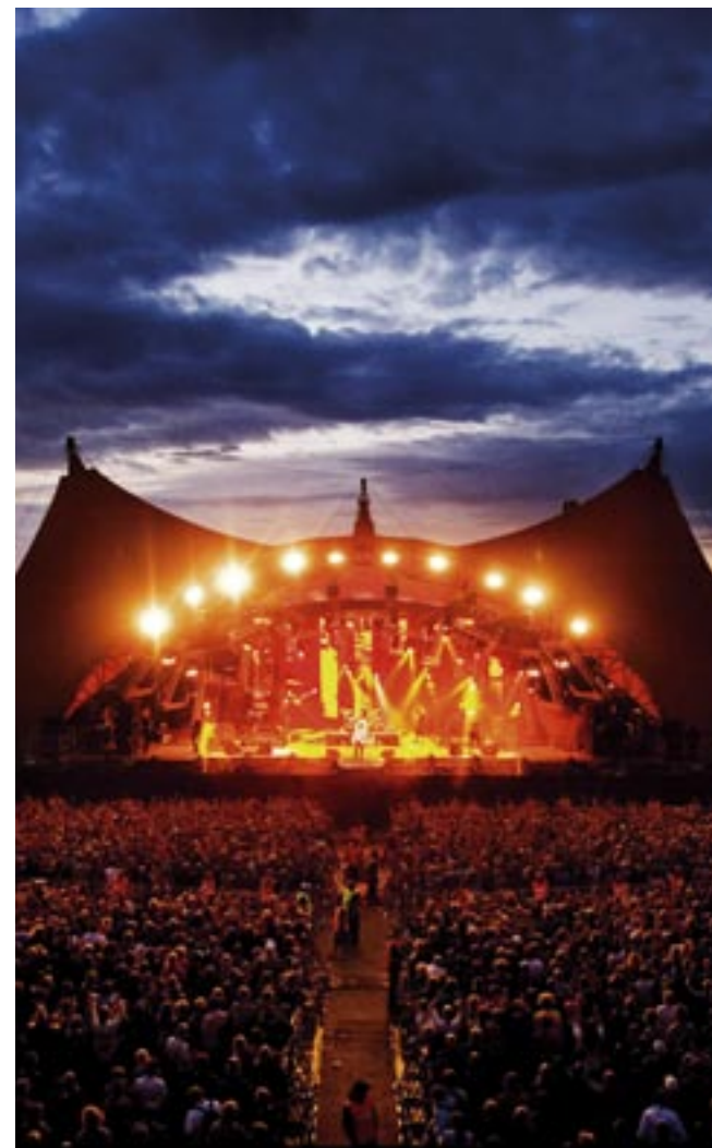
Ungdomsgruppen har i flere år været aktiv i foreningens oplysnings- og fortalerarbejde på Roskilde Festivalen.

Ungdomsgruppen mødes hver måned for at diskutere forskellige temaer af betydning for foreningens sag. På møderne planlægges fremtidige aktiviteter, så som workshops, seminarer og netværksdeltagelse, og derudover bruges møderne til tilbagemelding og evaluering af gruppe-medlemmernes individuelle og fælles aktiviteter.